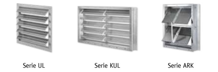
Serie UL Serie KUL Serie ARK