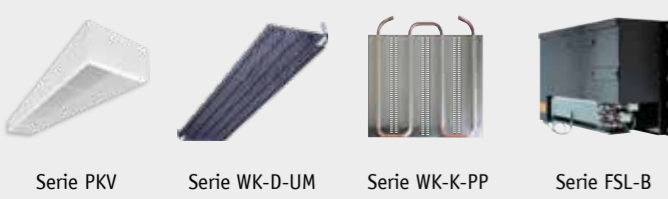
Serie PKV Serie WK-D-UM Serie WK-K-PP Serie FSL-B