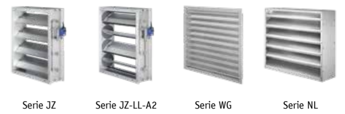
Serie JZ Serie JZ-LL-A2 Serie WG Serie NL