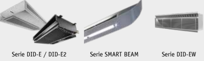
Serie DID-E / DID-E2 Serie SMART BEAM Serie DID-EW

Instalación en pared y antepecho de ventana