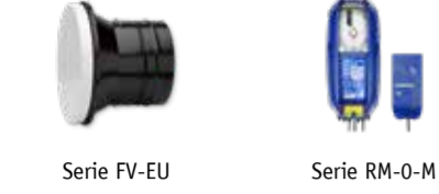
Serie FV-EU Serie RM-0-M