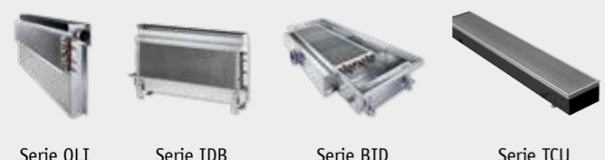
Serie QLI Serie IDB Serie BID Serie TCU