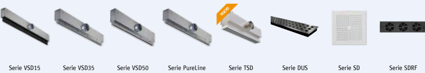
Serie VSD15 Serie VSD35 Serie VSD50 Serie PureLine Serie TSD Serie DUS Serie SD Serie SDRF