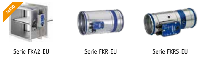
Serie FKA2-EU Serie FKR-EU Serie FKRS-EU