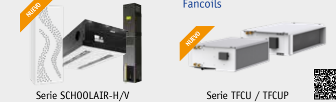
Serie SCHOOLAIR-H/V Serie TFCU / TFCUP