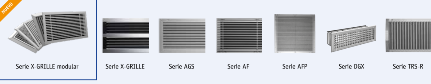
Serie X-GRILLE modular Serie X-GRILLE Serie AGS Serie AF Serie AFP Serie DGX Serie TRS-R