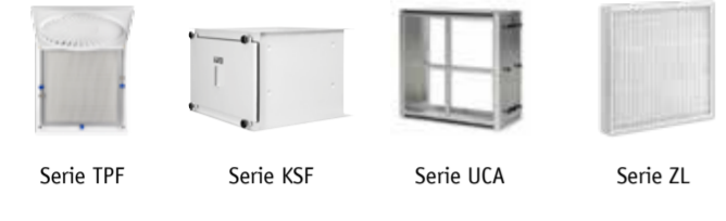
Serie TPF Serie KSF Serie UCA Serie ZL

Filtros absolutos con unidad terminal de aire