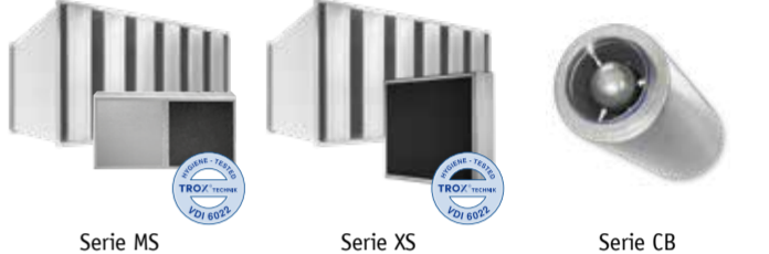
Serie MS Serie XS Serie CB