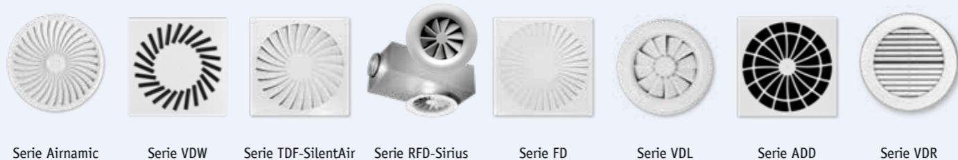
Serie Airnamic Serie VDW Serie TDF-SilentAir Serie RFD-Sirius Serie FD Serie VDL Serie ADD Serie VDR