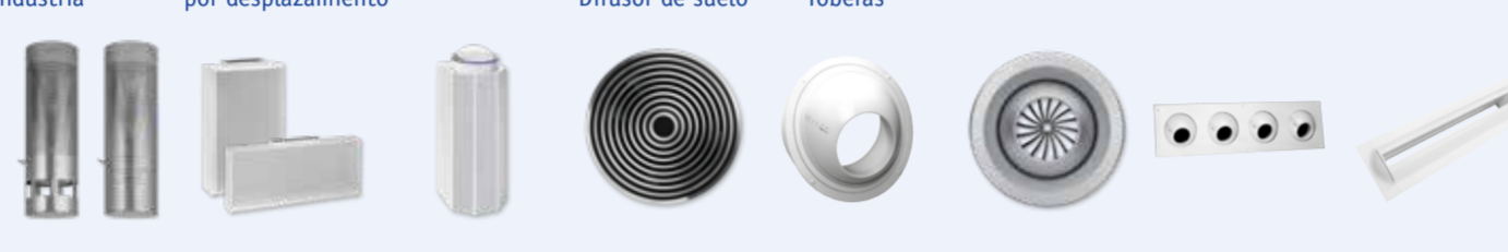
Serie ISH / QSH Serie QLE / QLF Serie QLV-90/180 Serie FB Serie DUE Serie TJN Serie DUE-M Serie DUL