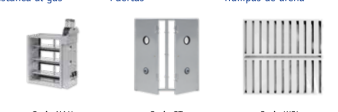
Serie NAK Serie ST Serie WSL