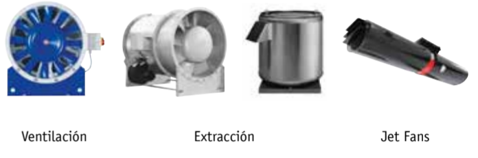
Ventilación Extracción Jet Fans