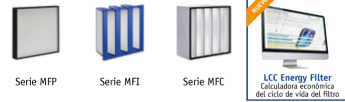
Serie MFP Serie MFI Serie MFC LCC Energy Filter