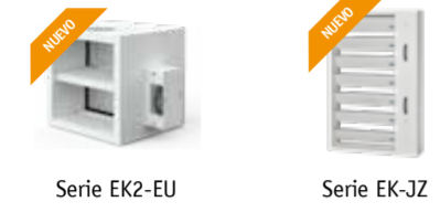
Serie EK2-EU Serie EK-JZ