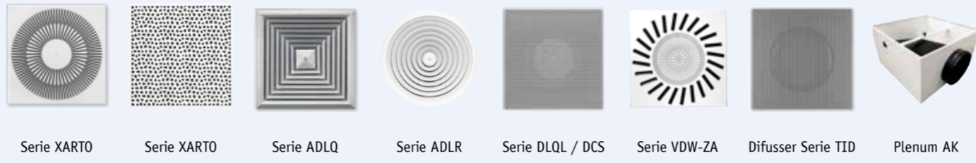
Serie XARTO Serie XARTO Serie ADLQ Serie ADLR Serie DLQL / DCS Serie VDW-ZA Difusser Serie TID Plenum AK