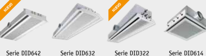
Serie DID642 Serie DID632 Serie DID322 Serie DID614